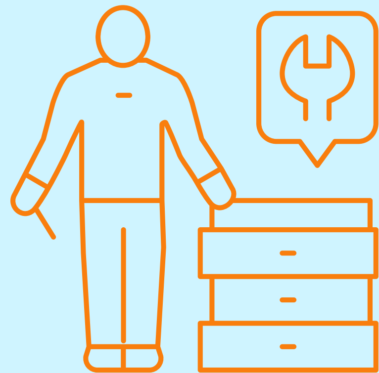
PINTURA Y SAMBLASTEO